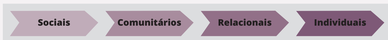
Quadro 2 – Fatores determinantes da violência, segundo o modelo ecológico da violência

Os Programas e Projetos de Prevenção Primária devem assentar no reconhecimento de que a violência contra as mulheres, a violência doméstica e a violência de género são o resultado de uma multiplicidade de fatores interligados, aos níveis individual, relacional, comunitário e social, numa perspetiva multidimensional e holística. O modelo ecológico da violência (cf. Quadro 2) estabelece um quadro conceptual e interpretativo desses fatores.