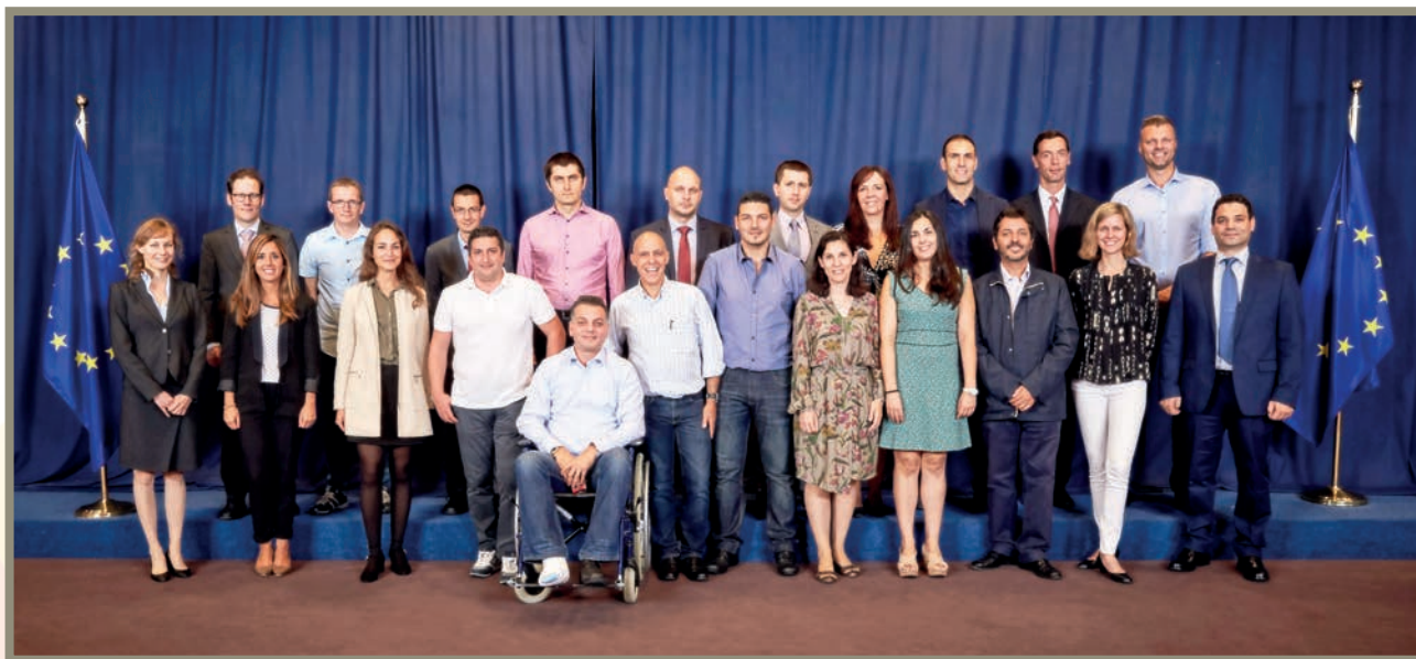
Esta fotografia reflete a diversidade do nosso pessoal e, por isso, constitui um bom exemplo de comunicação inclusiva

Para promover a diversidade nas publicações – como os folhetos – use fotografias e imagens que reflitam todos os aspetos do nosso ambiente de trabalho: tenha em consideração o equilíbrio entre mulheres e homens, mostre pessoas com deficiência em situações do quotidiano e inclua pessoas de diferentes idades e de diferentes grupos raciais e étnicos, se for caso disso.