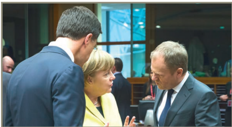
Bom exemplo de uma fotografia que ilustra o papel ativo das mulheres políticas