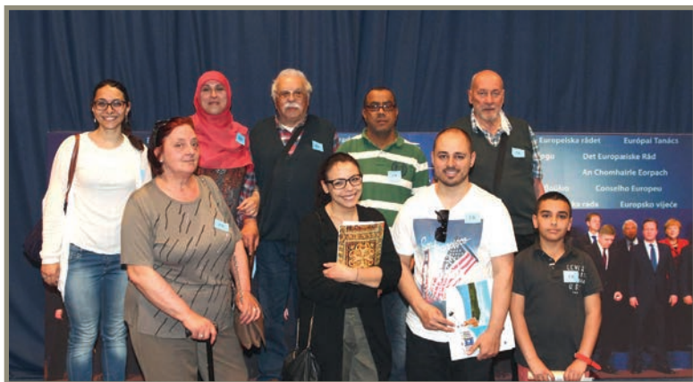
Bom exemplo de uma imagem que reflete a diversidade étnica

A diversidade deve ser tida em conta de forma sistemática, sempre que possível.